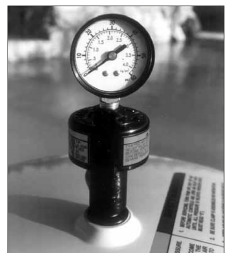
Manomètre de contrôle de l'encrassement