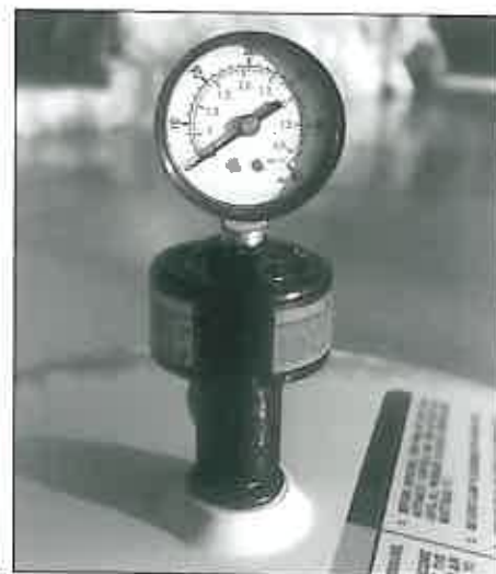
Manomètre de contrôle de l'encrassement